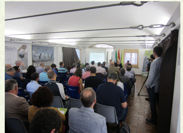
Video presentación Red